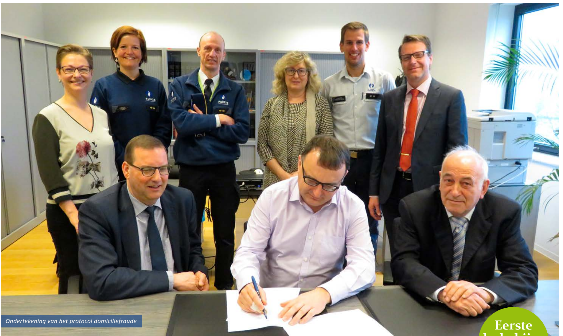
Ondertekening van het protocol domiciliefraude

Sociale Huisvestingsmaatschappij Vlaamse Ardennen HUURDESKRANT ■ JULI 2017 ■ EDITIE 5 ■ ANTWERPEN X